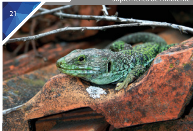
Crónicas do Meu Jardim Parte 3: Os répteis