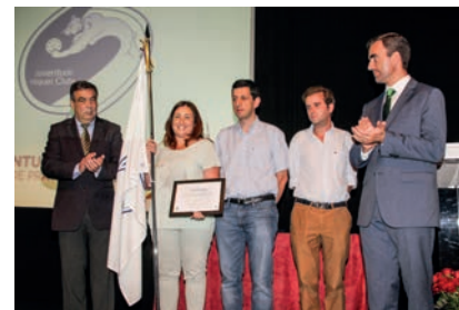
Medalha de Prata – Juventude Hóquei Clube

modalidade, com vários dos seus associados a registarem resultados brilhantes nos campeonatos de velocidade, fundo e meio fundo, e no prémio da Anilha de Ouro.