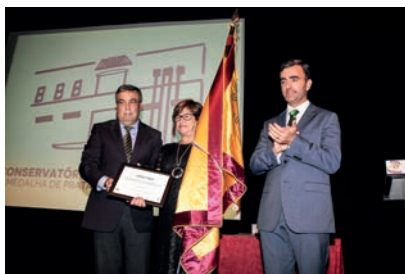
Medalha de Prata – Conservatório do Vale do Sousa

Foi também distinguido o Juventude Hóquei Clube que, apesar da sua juventude, congrega um significativo número de atletas para a prática do hóquei em campo e do hóquei de sala.