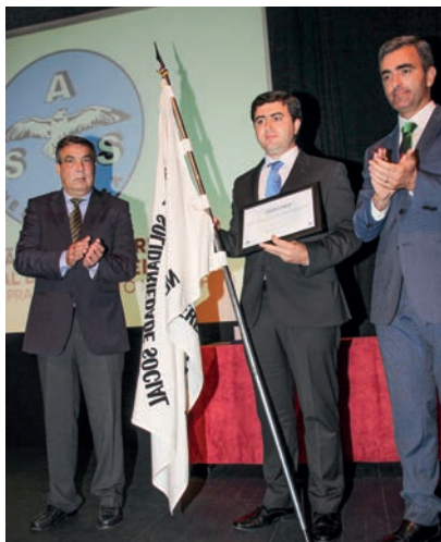
Medalha de Prata – Associação de Solidariedade Social de Nespereira