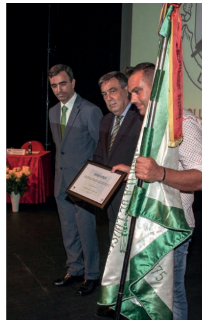
Medalha de Prata – Sociedade Columbófila de Lousada